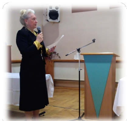
Główna Księgowa Okręgowej Izby podczas przedstawiania sprawozdań finansowych