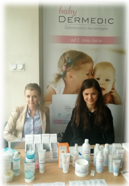
Prezentacja produktów firmy Dermedic