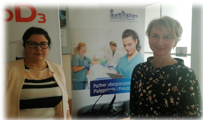
Przedstawiciele firmy Inter Ubezpieczenia