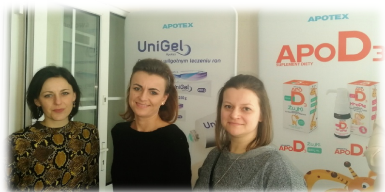
Przedstawiciele firmy Apotex