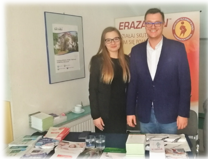
Pokaz produktów firmy Solpharm