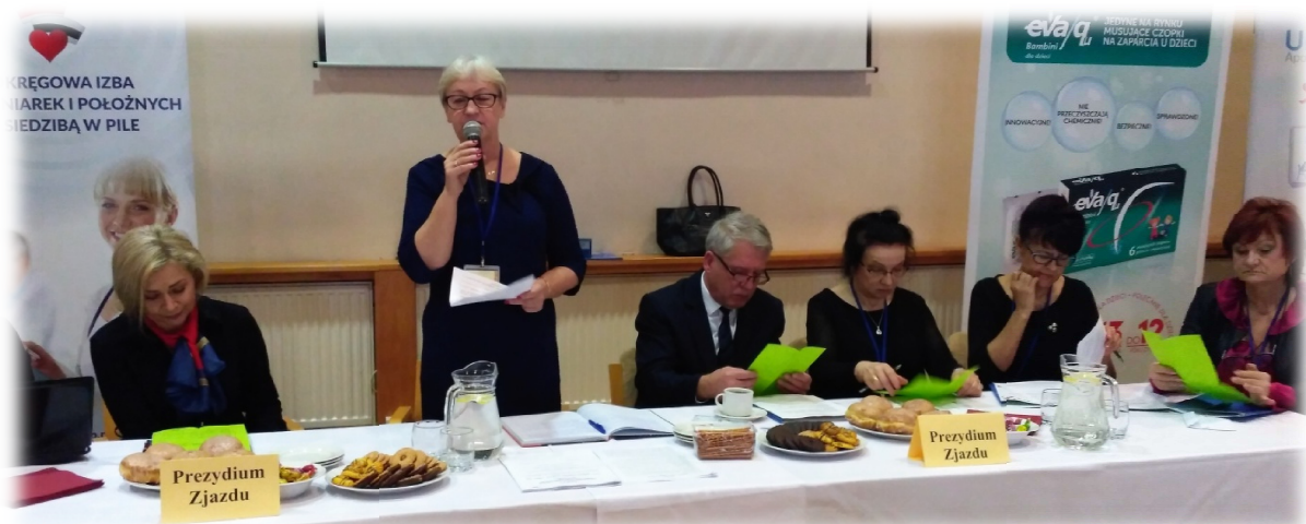
Prezydium XXXII Zjazdu Sprawozdawczo-Budżetowego