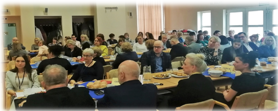
Delegaci XXXII Zjazdu Sprawozdawczo-Budżetowego