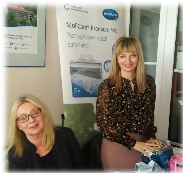
Przedstawiciele firmy Paul Hartmann