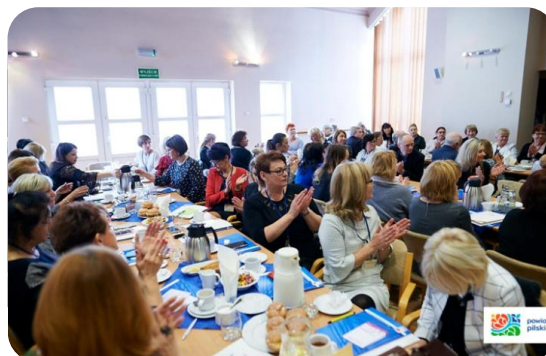
Delegaci XXXI Zjazdu Sprawozdawczo-Budżetowego

Osobne podziękowania skierowano do sponsorów XXXI Zjazdu Sprawozdawczo – Budżetowego Delegatów Okręgowej Izby Pielęgniarek i Położnych z siedzibą w Pile, którymi byli: