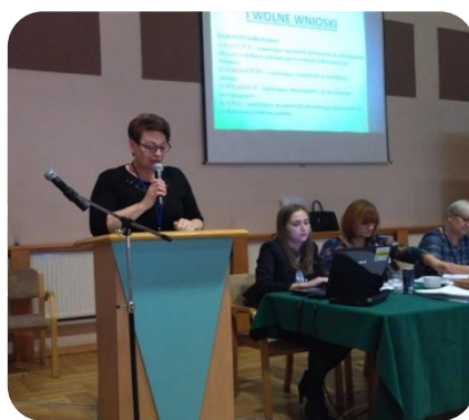
Wystąpienie Danuty Celkowskiej Przewodniczącej Komisji Socjalnej