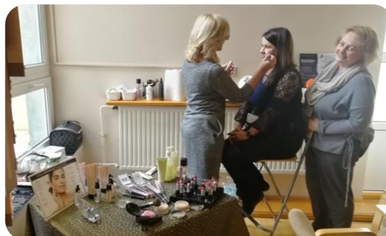
Pokaz produktów firmy Mary Kay