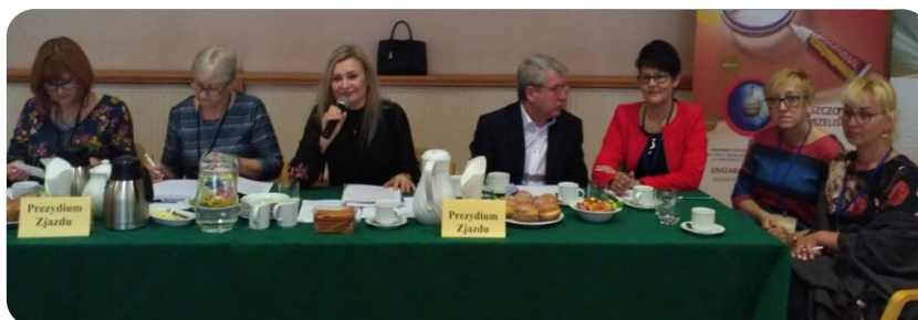
Prezydium XXXI Zjazdu Sprawozdawczo-Budżetowego