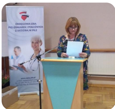
Sprawozdanie Przewodniczącej Komisji ds. położnych