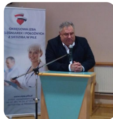
Przewodniczący Komisji ds. Kształcenia i Doskonalenia Zawodowego podczas przedstawiania sprawozdania

Po przyjęciu sprawozdań Komisja Uchwał i Wniosków przedstawiła oświadczenie, apele i wnioski zgłoszone podczas XXXI Zjazdu przez Delegatów: