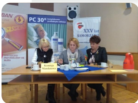
Komisja Uchwał i Wniosków