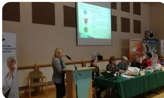
Prezentacja produktów firmy Convatec