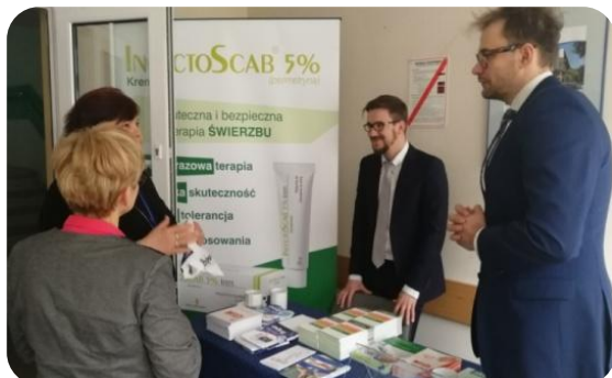
Przedstawiciele firmy Solpharm